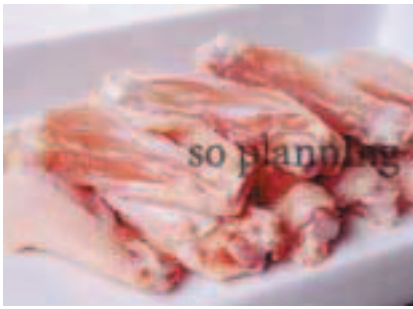
手羽先 / スティック D-C002C