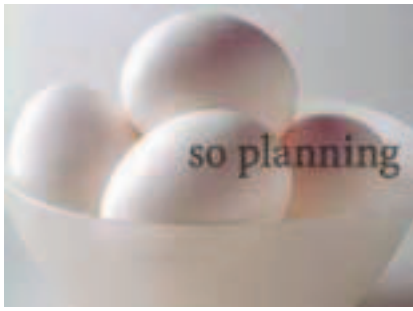
鶏卵 / 白玉 D-C005C