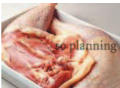
もも / 骨付き D-C015C