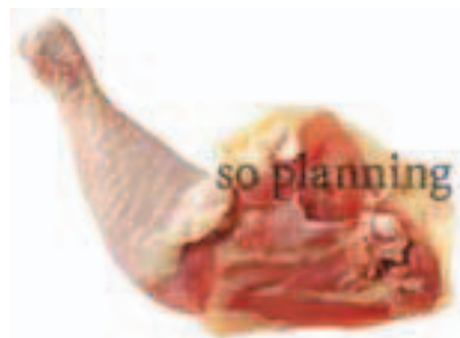
もも / 骨付き D-C015A