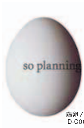
鶏卵 / 白玉 D-C005A