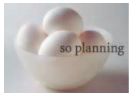
鶏卵 / 白玉 D-C005B