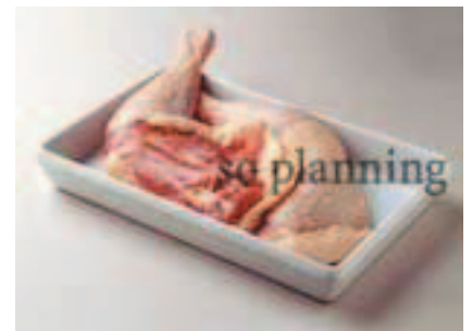
もも / 骨付き D-C015B