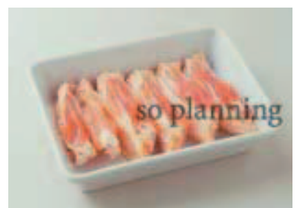
手羽先 / スティック D-C002B2