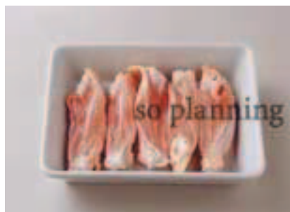
手羽先 / スティック D-C002B