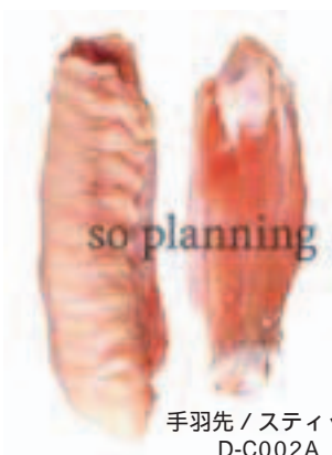
手羽先 / スティック D-C002A