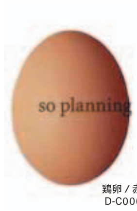
鶏卵 / 赤玉 D-C006A