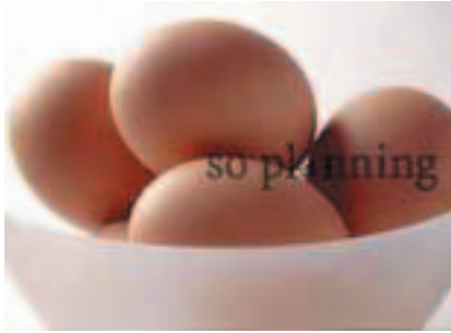
鶏卵 / 赤玉 D-C006C