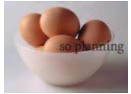
鶏卵 / 赤玉 D-C006B