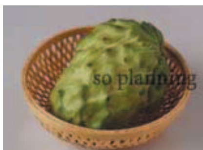
カスタードアップル B-H002B