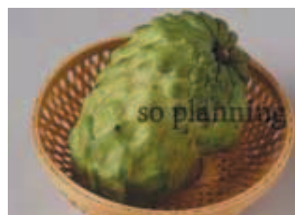
カスタードアップル B-H002C