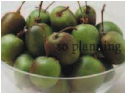
ミニキウイフルーツ B-G013C