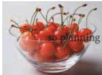
さくらんぼ (佐藤錦) B-G010B