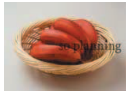
モロード (バナナ) B-G015B