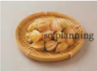
ほおづき (ストロベリートマト) B-G018B