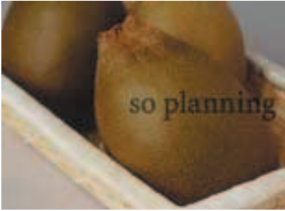
ゴールデンキウイ B-G012C