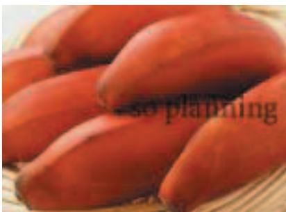
モロード (バナナ) B-G015C