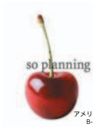
アメリカンチェリー B-G011A