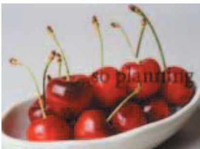
アメリカンチェリー B-G011C