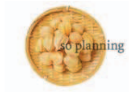
ほおづき (ストロベリートマト) B-G018A