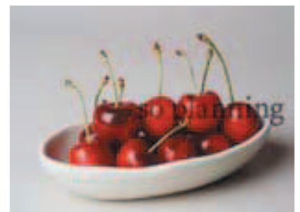
アメリカンチェリー B-G011B