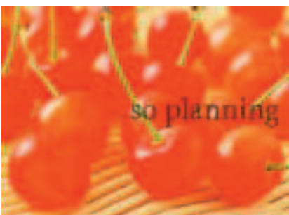
さくらんぼ (佐藤錦) B-G010C2