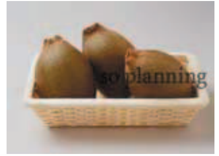
ゴールデンキウイ B-G012B