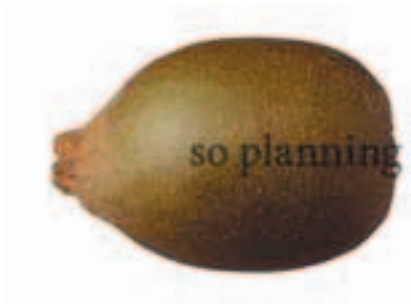
ゴールデンキウイ B-G012A