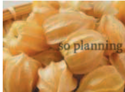
ほおづき (ストロベリートマト) B-G018C