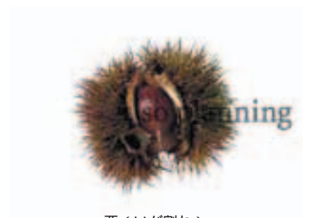
栗 (いが割れ) B-G005A