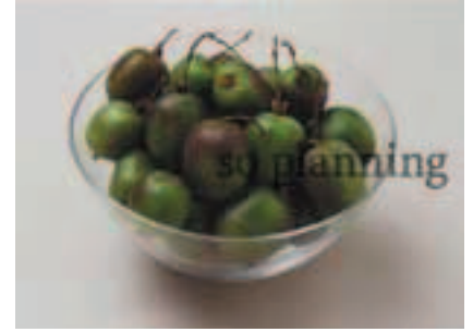
ミニキウイフルーツ B-G013B