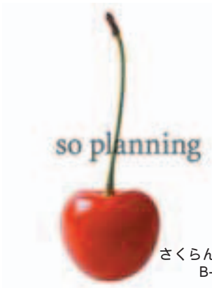
さくらんぼ (佐藤錦) B-G010A