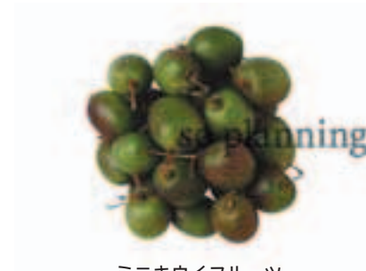
ミニキウイフルーツ B-G013A