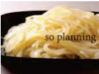
冷麺 / ゆで E-B006C