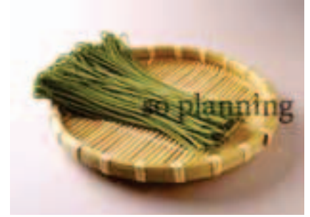
茶そば / 半生 E-B005B