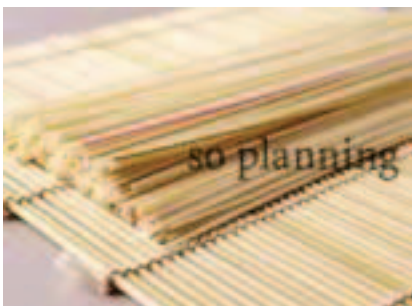
ひやむぎ / 乾 E-B007C