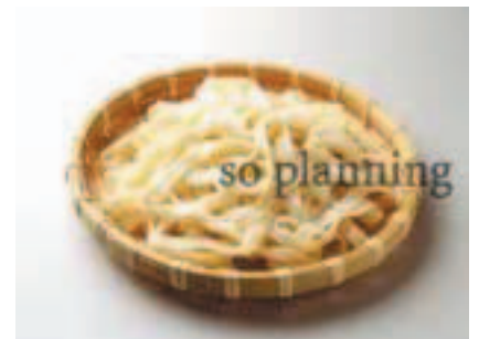
きしめん / ゆで E-B002B