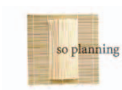
ひやむぎ / 乾 E-B007A