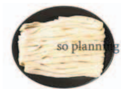
ほうとう / 生 E-B009A