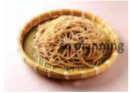
そば / 生 E-B004B