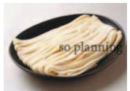
ほうとう / 生 E-B009B