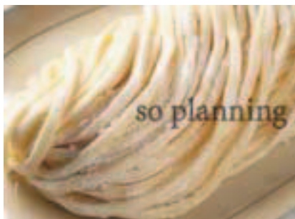
うどん / 生 E-B008C