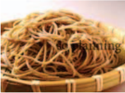
そば / 生 E-B004C