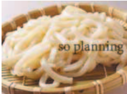
うどん / ゆで E-B001C