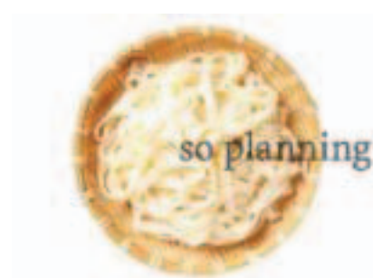
きしめん / ゆで E-B002A