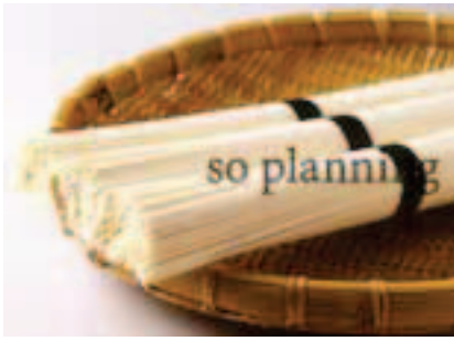
そうめん / 乾 E-B003C