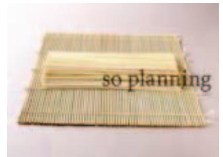
ひやむぎ / 乾 E-B007B