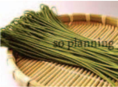
茶そば / 半生 E-B005C