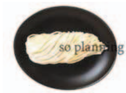
うどん / 生 E-B008A