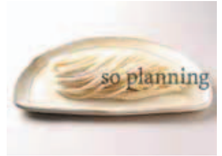
うどん / 生 E-B008B