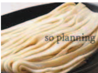
ほうとう / 生 E-B009C