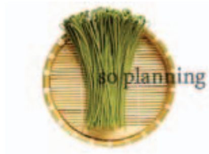
茶そば / 半生 E-B005A