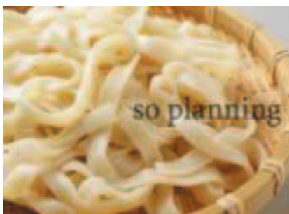
きしめん / ゆで E-B002C