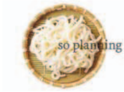
うどん / ゆで E-B001A