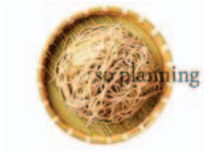
そば / 生 E-B004A