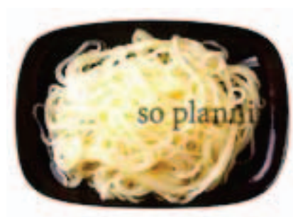
冷麺 / ゆで E-B006A