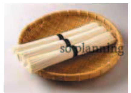
そうめん / 乾 E-B003B