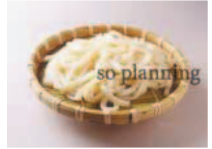
うどん / ゆで E-B001B