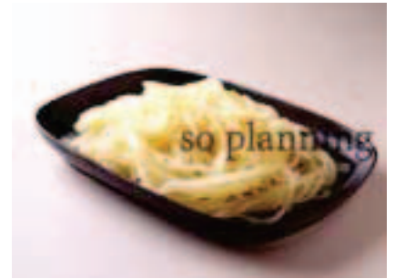
冷麺 / ゆで E-B006B