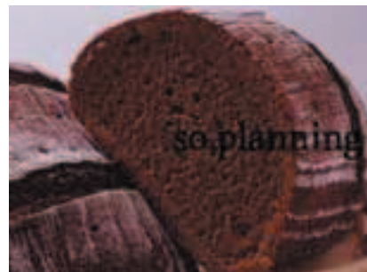
ロッケンミッシュブロート E-N008C