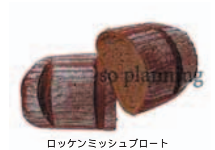
ロッケンミッシュブロート E-N008A