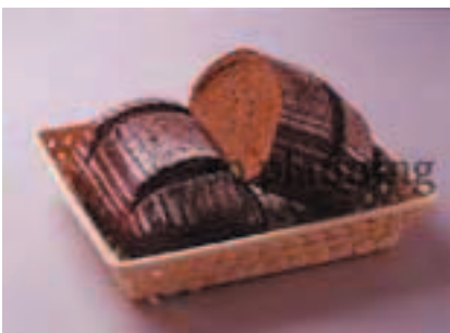
ロッケンミッシュブロート E-N008B